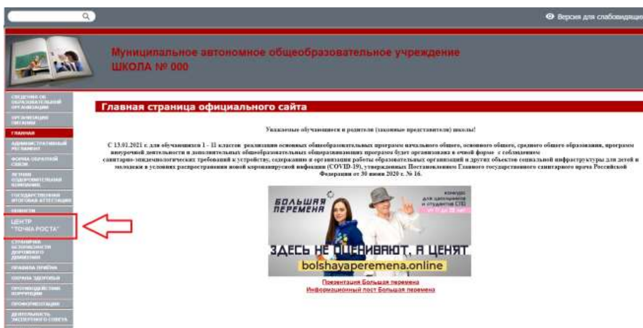
Рисунок 2. Пример размещения ссылки на раздел на сайте общеобразовательной организации

На официальном сайте общеобразовательной организации, в которой создается центр образования естественно-научной и технологической направленностей «Точка роста» (далее – центр «Точка роста», центр) в рамках федерального проекта «Современная школа» национального проекта «Образование», не позднее даты начала функционирования центра (не позднее 1 сентября года создания центра) создается раздел «Центр «Точка роста». Ссылка на раздел размещается в главном меню сайта общеобразовательной организации и должна быть видима при просмотре каждой страницы. Ссылка не может являться вложенной в другие меню. Пример размещения ссылки на раздел «Центр «Точка роста» в меню официального сайта общеобразовательной организаций в информационно-телекоммуникационной сети «Интернет» приведен на рисунке 2.