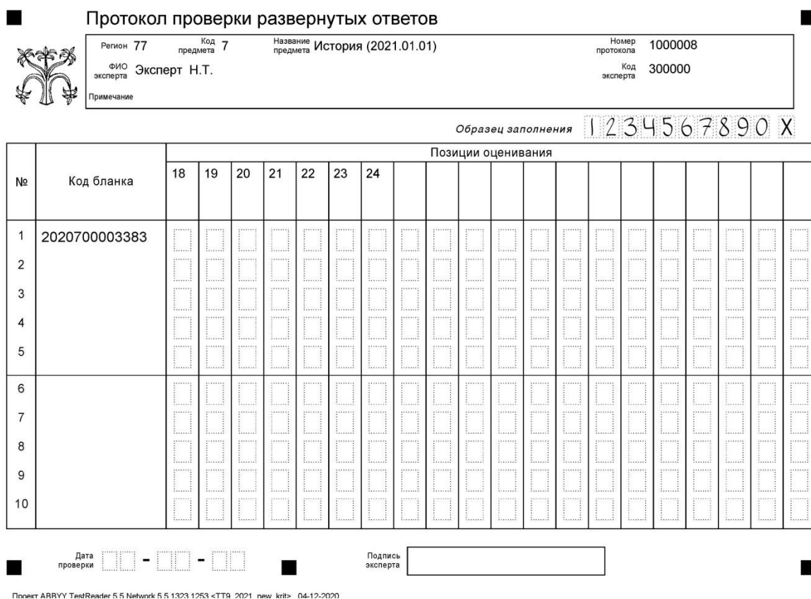
Рисунок 1. Вариант формата бланка протокола проверки развернутых ответов 1

Внимание! При выставлении баллов за выполнение задания в Протокол проверки развернутых ответов следует иметь в виду, что если ответ отсутствует (нет никаких записей, свидетельствующих о том, что экзаменуемый приступал к выполнению задания), то в протокол проставляется «X», а не «0».