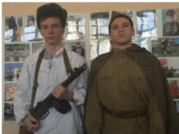
Ученицы МБОУ СОШ № 62