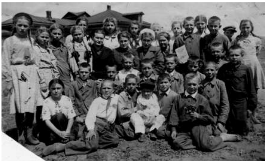
Один из послевоенных (40-х) выпусков Красюковской начальной школы № 3.