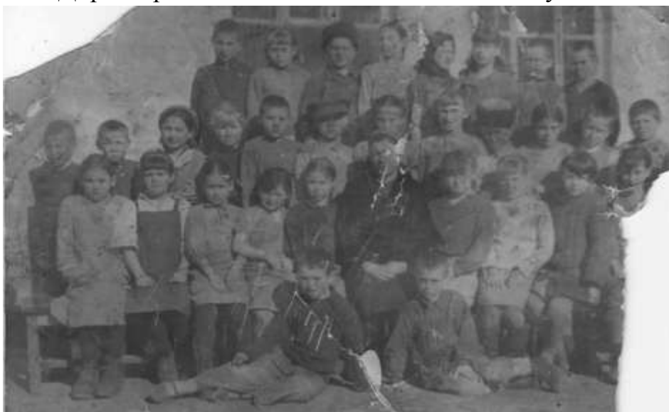
Ученики школы конца двадцатых годов XX - го века.