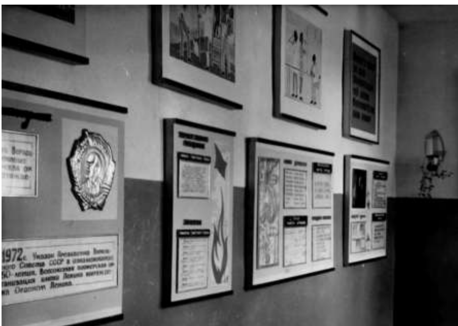
Пионерская комната и ее оформление.

учителем истории в Красюковской сш № 62 на вечернем (сменном) отделении. Вырастил двоих детей. Умер в 1978 году.