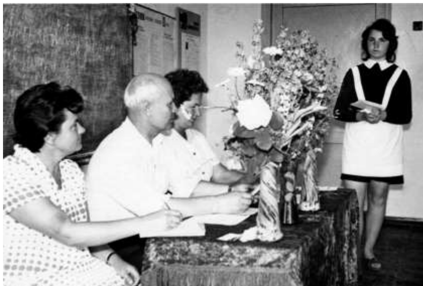
Сдача госэкзамена по литературе.

общественных дисциплин в ПУ-64 поселка Звереве. Награжден грамотой Министерства образования РФ. Ветеран труда. Воспитал двоих детей.