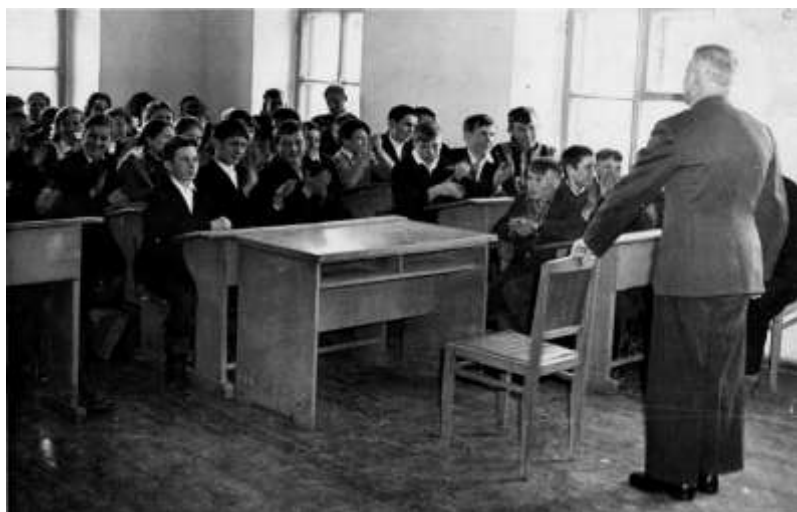
Встреча учащихся Красноюковской восьмилетней школы №62 с участником Великой Отечественной войны.