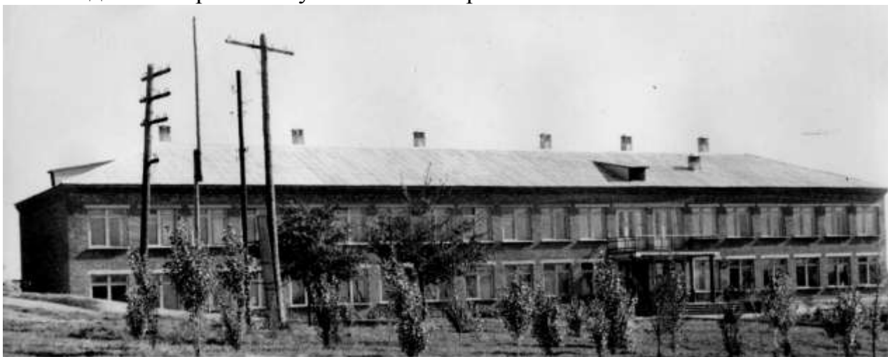
Новое здание Красюковской средней общеобразовательной школы №62. 1972 г.