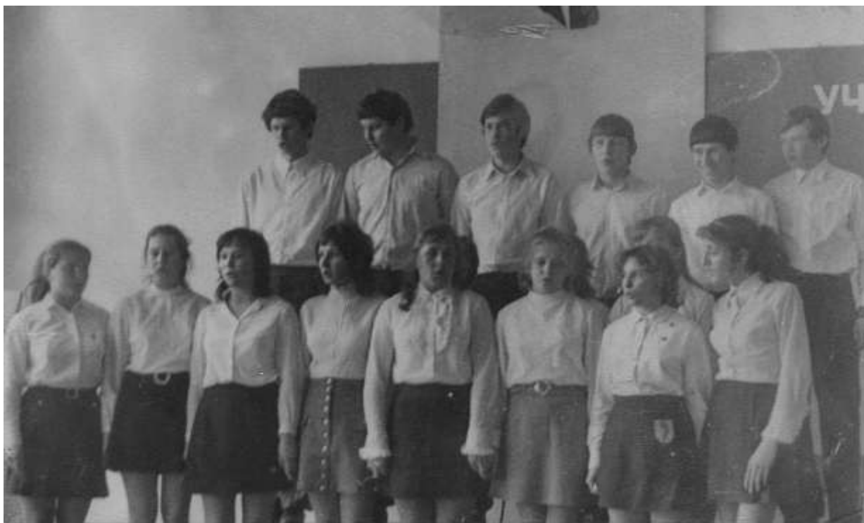
На сцене школьного актового зала хор старшеклассников.